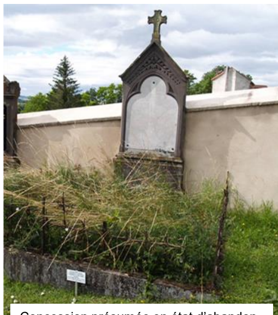
Concession présumée en état d'abandon

Les travaux d'enlèvement des monuments funéraires, l'exhumation des restes, la réinhumation dans l'ossuaire municipal ainsi que la création des documents administratifs officiels ne se feront qu'au moment de la remise à la vente des concessions ainsi libérées.