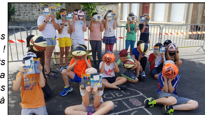
Les enfants de CM 2 n'ont pas pu partir en voyage scolaire cette année... pour adoucir cette déception l'Amicale laïque a offert un cadeau.

Violaine reprend : « Les familles ont joué le jeu : les fiches de lectures, les exercices de maths étaient faits ! Nous avons envoyé des corrections, avec des petits messages pour garder le lien avec les enfants. La difficulté a été de « doser » la quantité de travail et nous avons laissé chacun gérer à son rythme les notions à retenir ».